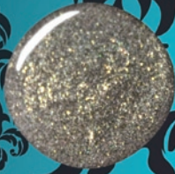
ALLOVER GLAM 09-270-169