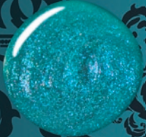
BE A MERMAID 09-270-168