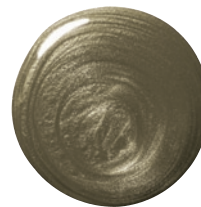
PEARL OLIVE 01-098-034