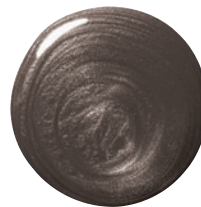
PEARL GRAPHIT 01-098-033