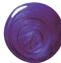
PEARL BLUE LILAC 01-098-037