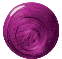
PEARL PLUM 01-098-038