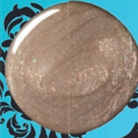
BEAUTY QUEEN 09-270-170