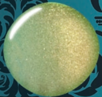
PERIOD ILLUSION 09-270-171