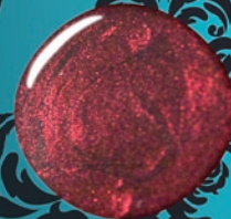
LADIES LOVE 09-270-172